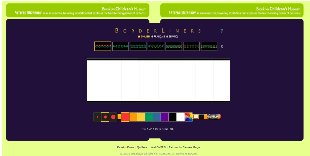
Figura 1. Página inicial do Borderliners