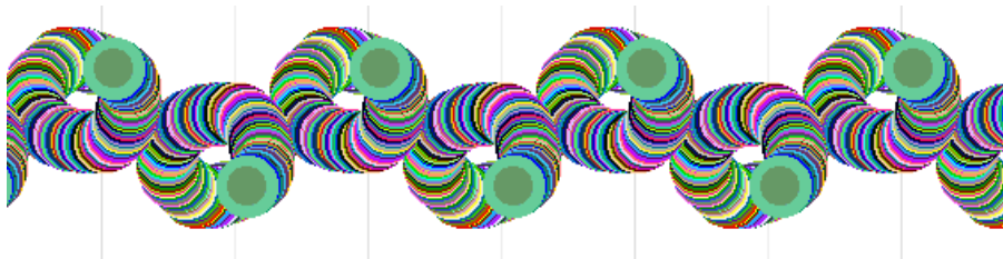
Figura 5. Exemplo de friso

4. A Figura 5 ilustra um exemplo de friso obtido de forma rápida e simples.